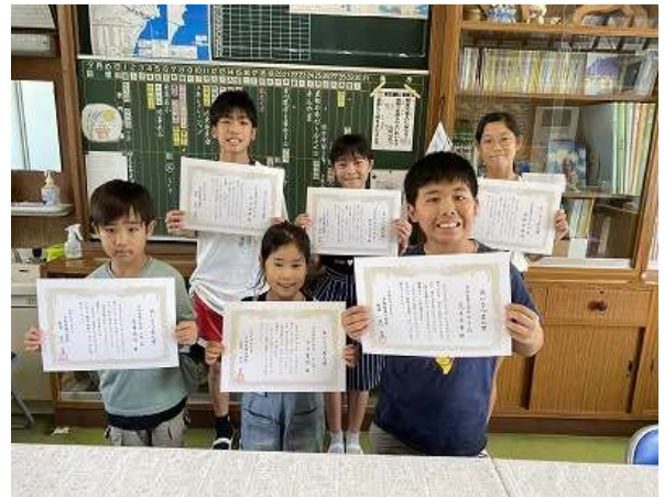
【7・8月のあいさつ名人】

9月の「あいさつ名人」も見つけているところです。地域であいさつをがんばっている児童がいましたら、学校に連絡してください。(TEL53-4022)