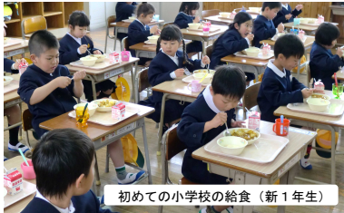
初めての小学校の給食（新1年生）

四月六日に新学期を迎えた門川小学校。九日の入学式で六十七名の新一年生を迎え、全校児童数四百二名で新年度がスタートしました。まずは、ご入学、ご進級、誠にありがとうございました。