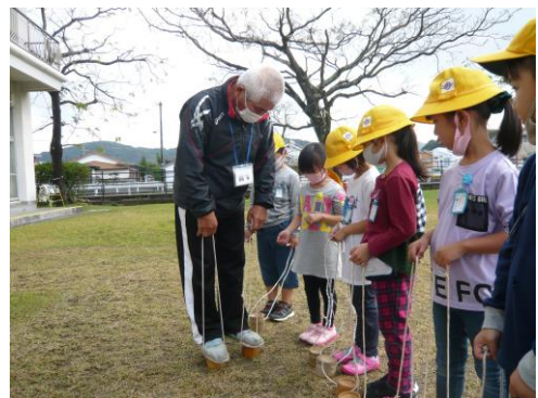
【1年 昔の遊びを教えてもらおう】

2学期も保護者の皆様、地域の皆様には本校の教育活動にご理解・ご協力をいただき、誠にありがとうございました。少し早いですが、よいお年をお迎えください。