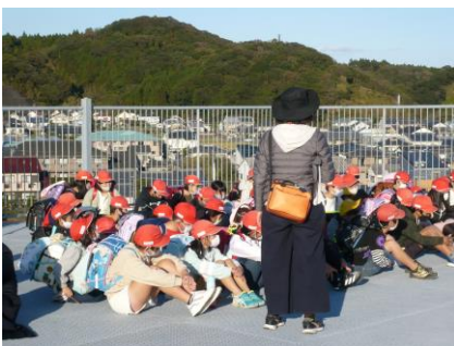
【草川小屋上の様子】