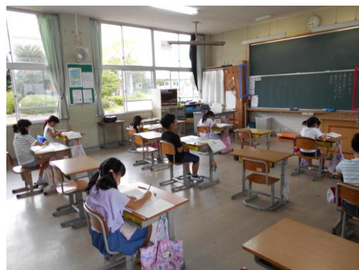
【分散登校（2年授業）の様子】