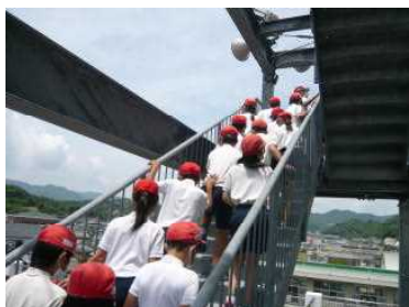
【避難の様子（昨年度）】

この学習を通して最も意識させたいことは「絆」です。東日本大震災で一人一人が改めて気づいた「絆」の大切さを、学習全体を通して学んでいきます。学習があった日、子どもたちには、「家族と話をすること」という宿題が出されます。その子なりに考えた「避難場所のこと」「津波でんでんこのこと」「日常生活の中で防災のこと」を話すと思います。子どもと一緒に家庭や地域での「絆」について考える機会にしていいただければと思います。