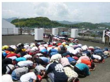
【だんごむしのポーズ（昨年度）】