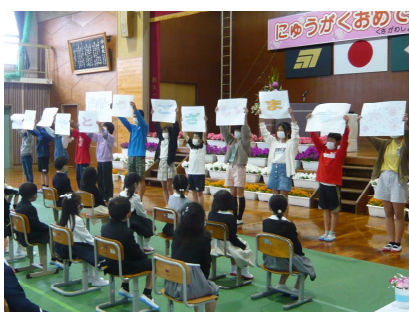
入学式で、温かく1年生を歓迎する6年生

感染症での制約がある中での学校生活も3年目を迎えました。そんな中でも「今年1年間、頑張るぞ!」という子どもたちの意欲は少しも変わりません。今年度もいろいろな制約の中での学校生活ですが、草小っ子はコロナに負けずに頑張ります。私たち職員も、子どもたちの気持ちに応えられるよう精一杯頑張っていきます。