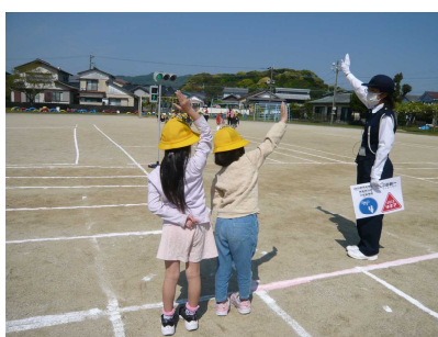
交通教室で横断の仕方を練習する1年生