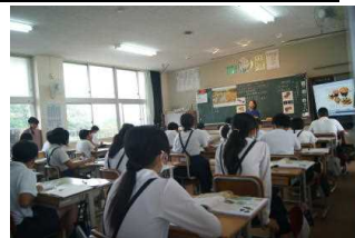
【6年の参観授業の様子】

6月28日(金)に1・3・5年、7月2日(火)に2・4・6年生の参観日を行いました。4月21日(日)以来の参観日ということで、多くの保護者の方に出席いただきました。