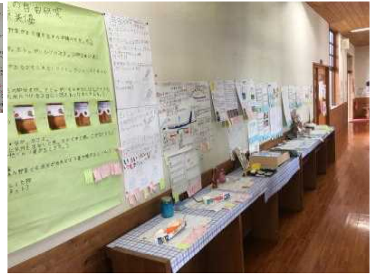
【理科室前廊下の展示の様子】