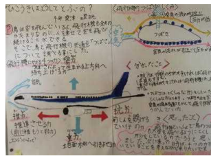
【ひこうきはどのようにとぶの?】