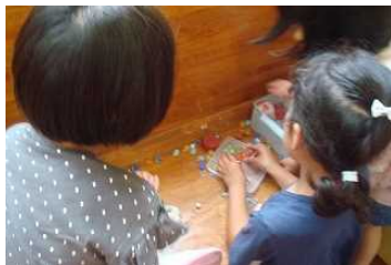
ビー玉、おはじき遊び♪