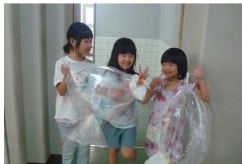
図工で作った作品で遊んだよ