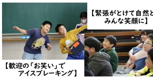
【緊張がとけて自然とみんな笑顔に】