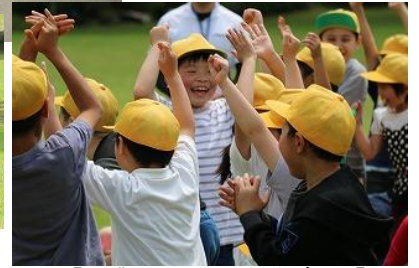
【大盛り上りの全校ゲーム】