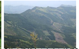
【秋政展望台から臨む絶景】 延岡市街や海が見えることも