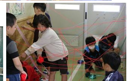
【友達と一緒にダイナミックな制作活動】