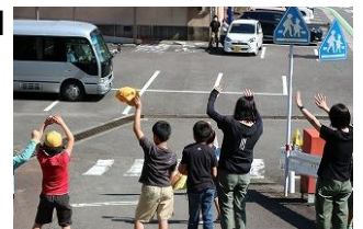
【また、10月に会おうね!】

M2学習では、考えを交流したり話し合いながら活動を進めたりして、互いの学校や友達のよさを感じたり、共に学びを深めたりします。新しい学年になったの再会で、また新たな気づきがあったことでしょうか。また、子どもたちにとって、普段とは違う先生の授業を受けることも楽しみの一つです。先生達の話聞く表情も真剣でした。～次回のM1・M2学習は、10月の社会科見学、宿泊学習です。