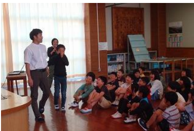
【今日はどんなことするのか、ワクワク】