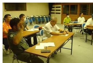
【事業者の方々と打合せの様子】

諸塚には、素晴らしい技術をもった方々がいらっしゃるということ、誰かのために行動することが自分自身を成長させることに大きく役立っていると実感できる仕事があるということ、身近にあると知らなかった憧れの仕事、諸塚のよさを生かす様々なアイデアを仕事に取り入れていることなど、事業所の方々とふれあい、そのお仕事の楽しさを体感することで、自分や諸塚の将来を考えるきっかけにできたらいいなと思っています。