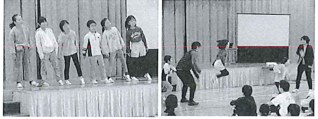
【2年生 できるようになったよ】

雨にも負けないように、 雪の日も頑張ります。 朝のぼりも元気です。 欲しいものは何でも。 一日一歩を大切に。 赤いバラを大切に。 どよみも大切に。 よそ見も大切に。 そなたも大切に。 メタセコイヤも大切に。 のびのびと成長。 1年生ががんばります。 行って帰って来ます。 2年生ががんばります。 行って帰って来ます。 3・4年生ががんばります。 怖がらなくていい。 5年生ががんばります。 つまらないから笑おう。 夢いっぱい笑顔いっぱい。 元気いっぱい笑顔いっぱい。 椎葉小学校に感謝。 みんなに幸せを届けます。 6年生みんなです。