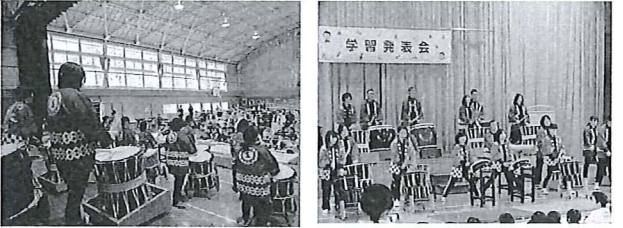
【椎小 六年座 もみじ太鼓】