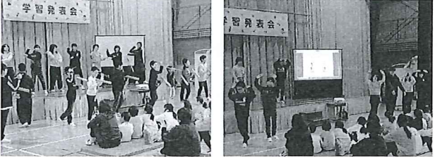
【5・6年生 ひえつき節 PR隊】