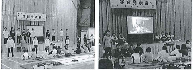
【3・4年生 伝えたい～椎葉の神楽～】