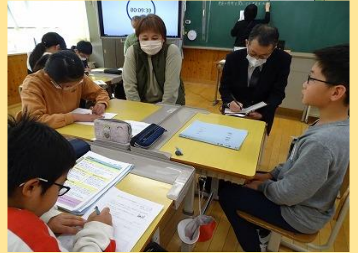
5 年 教 室 の 様 子