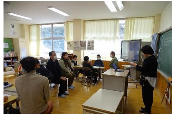
(児童発表の目的と本時の流れについて、それぞれの学級で説明する職員の様子)

今回は、児童3・4人を1つのグループにして各自がまとめた「自分のできること」「社会でできること」の2つの視点で発表に対する意見交換を3回ずつ行いました。