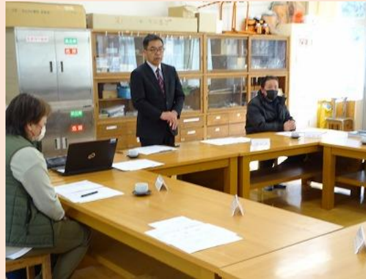
(挨拶をする日高校長)