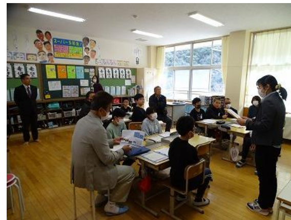
(これまでの学習を通しての学び・気づきを発表する児童と聞いてくださる委員の様子)