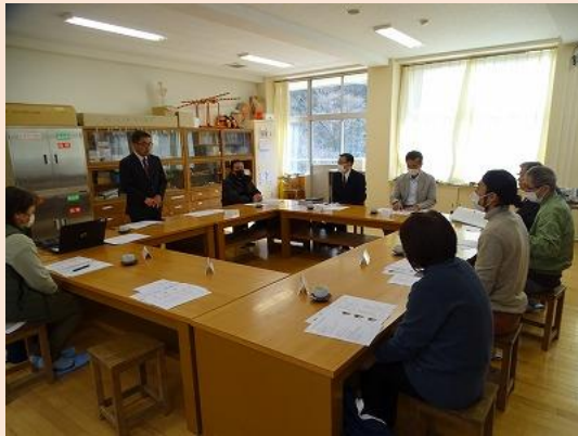
(学校運営協議会前半の様子)