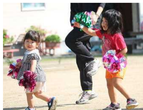
【とってもかわいいダンスです】