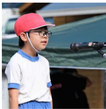
【ハキハキ発表しました】