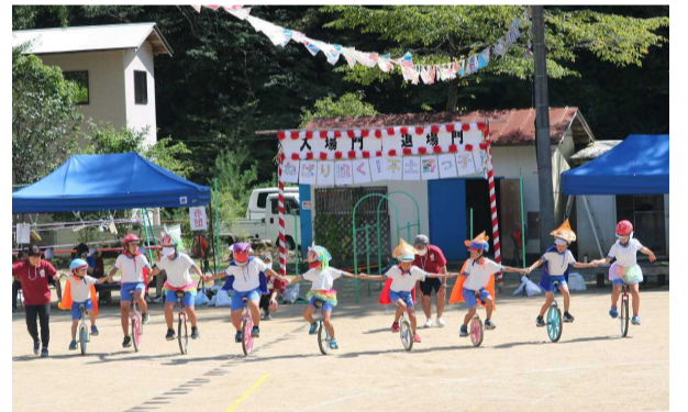
【声を掛け合い、協力した一輪車の表現】

運動会の準備から大会の運営、片付けに至るまで、たくさんの協力をありがとうございました。