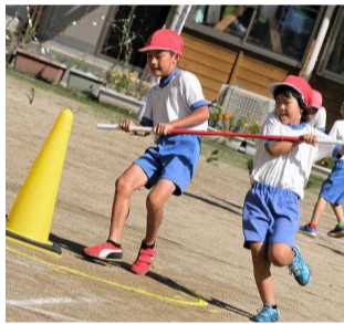
【協力してコーンを回ります】