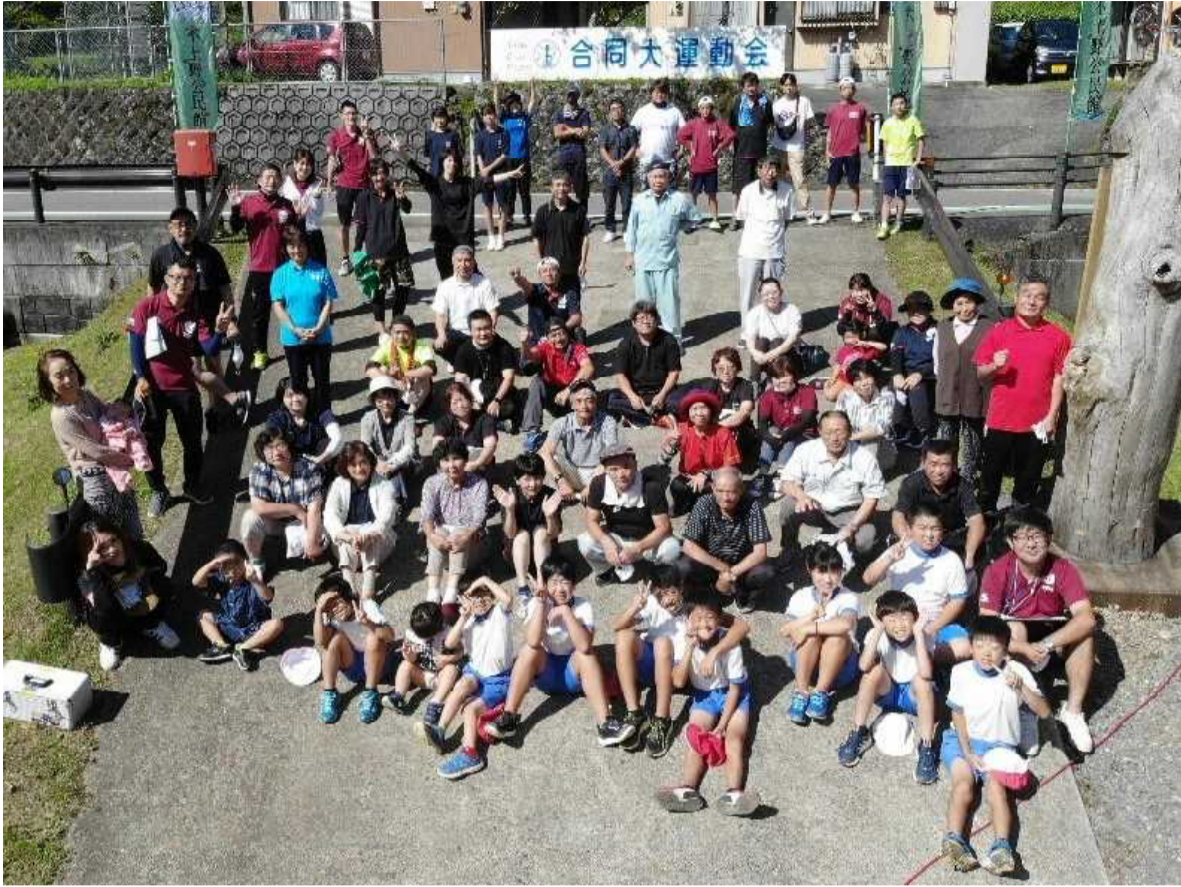
【不土野地区の皆さん 大集合！】