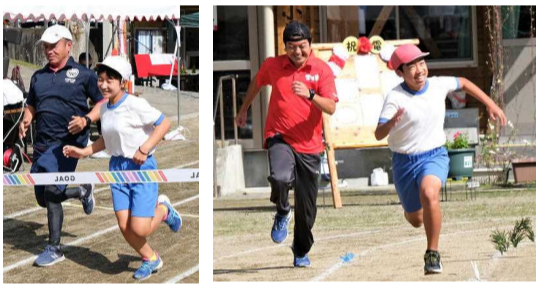
【お父さんとかけっこ】