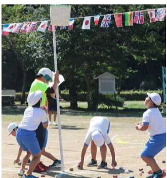
【赤白合わせて何と274個入りました】