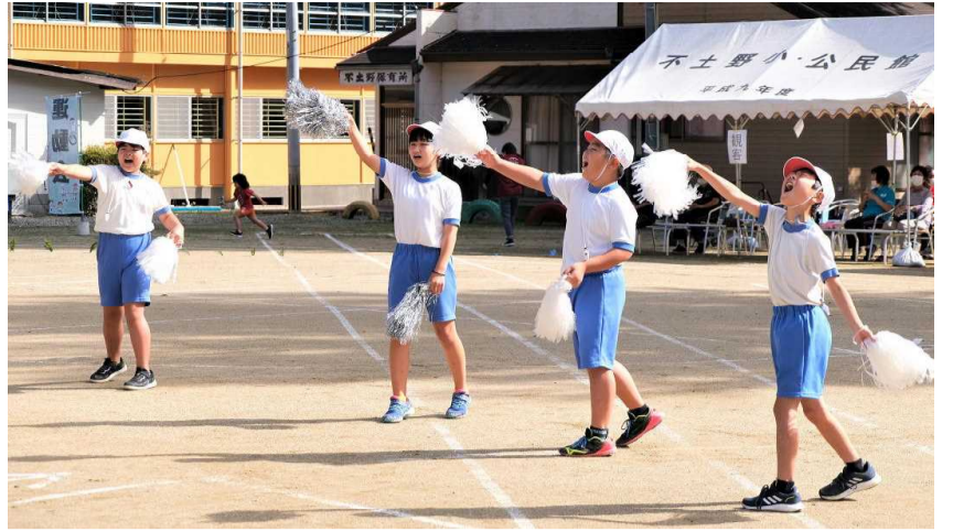
【白団も赤団も、よく声が出ていました】