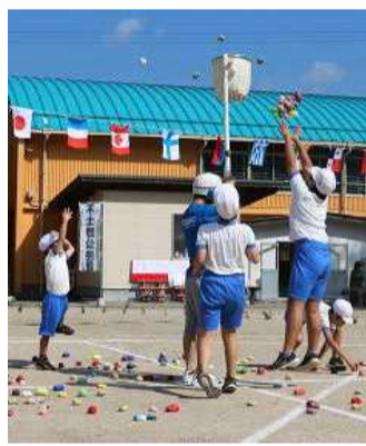
【玉入れも接戦 なんと1個の差でした】