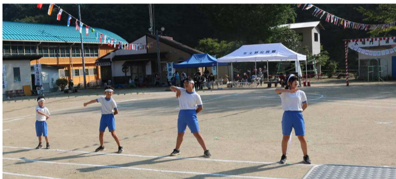
【エール交換です 赤団も白団も よく声が出ていました】