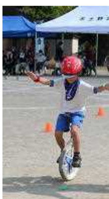
【練習も本番もがんばりました かなりレベルアップしています】