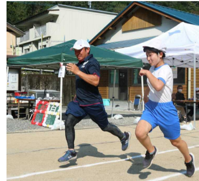
【お父さんとかけっこ】