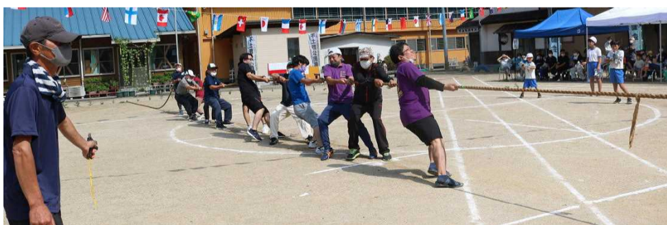
【綱引きは接戦で なんと引き分けでした】