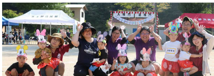
【かわいいダンス かけっこをありがとうございました】