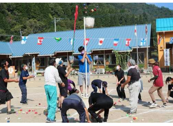
【玉入れ一般の部は 入りすぎてお手玉が残り少なかったです】