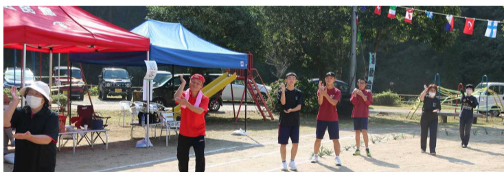
【ひえつき節がみなさん上手です】