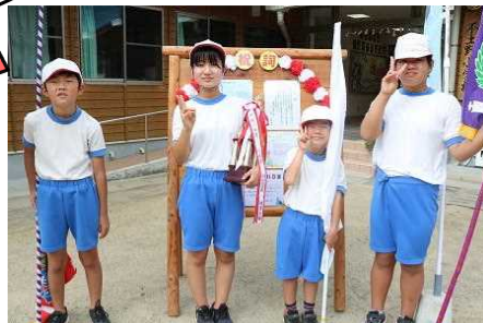
【始まる前です ドキドキワクワクしています】