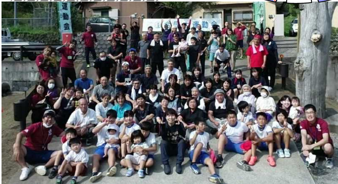
【不土野地区の皆さん 大集合！】