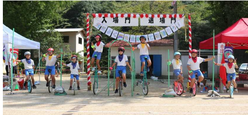
【やりきった！ という満足感を感じています】