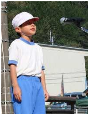
【ハキハキ発表しました】