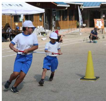
【協力してコーンを回ります】