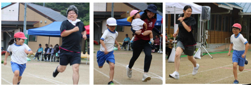
↑【お家の人との徒競走】 ↑