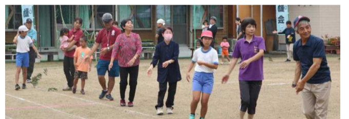
↑【地区の競技～力が入った綱引き・ひえつき節踊り・玉入れ】 ↓