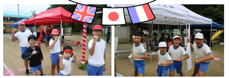
↑【始まる前です 気合いが入っています】