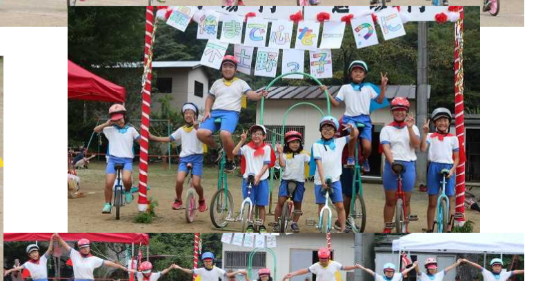
一輪車【練習も本番もがんばりました かなりレベルアップしています】 【やりきった！ という満足感が感じられました】