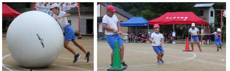
↑【団技～大玉転がし・台風の目・玉入れ】 ↓