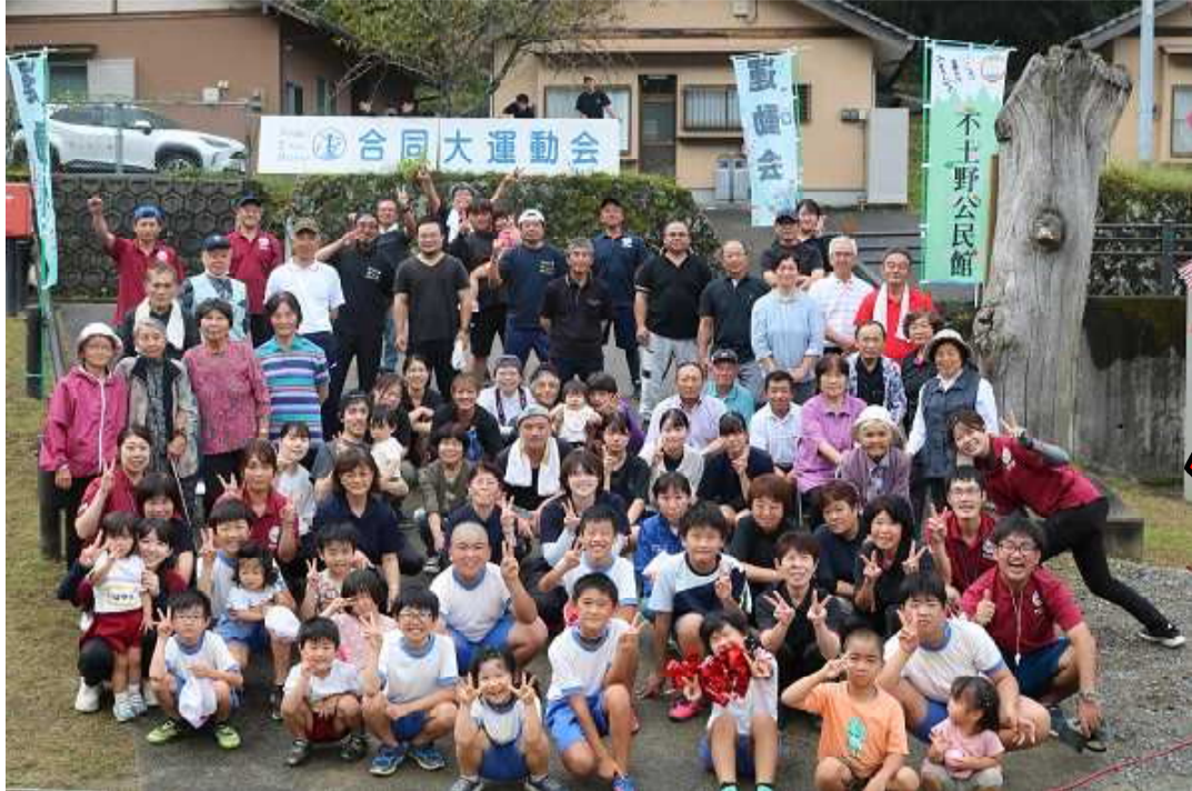
↑【ご来場いただいた皆様、全員で ハイポーズ！】