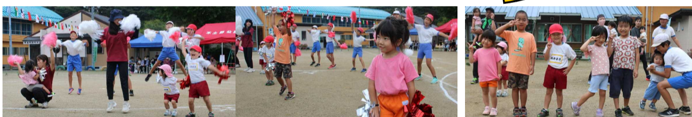
↑【幼児による かわいいダンス 元気いっぱいのかけっこ】 ↑