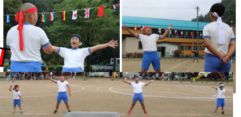
↑【エール交換 赤団も白団も よく声が出ていました】