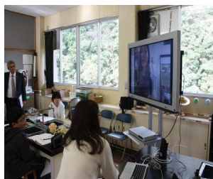
九州大学博物館と中継し質問をしています。

今年も、保護者や地域の皆様には温かいご支援を賜りました。皆様のお力添えをもちまして、大きなけがや事故もなく、充実した1年を終えることができました。心よりお礼申し上げます。