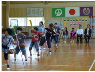
歓迎会 (やんばし踊りで歓迎)