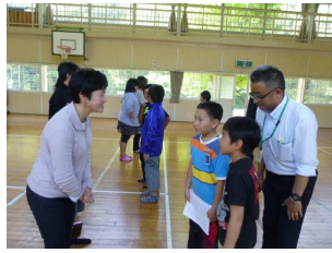
ホストファミリーとの対面