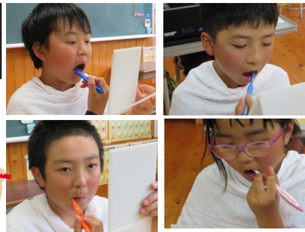
5・6年生 全国はみがき大会の様子