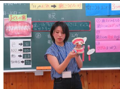
3・4年生 歯みがき指導の様子