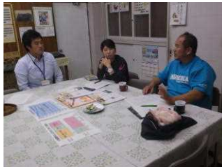
【5年担任との打合せ】

5年生は社会科で「これからの食料生産とわたしたち」という単元を勉強し、その中で「日本の食料生産が抱える問題」について保護者に話をし