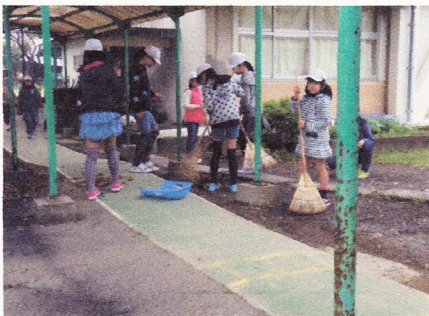
【6年生のボランティアの様子】

現在の活動内容としては、「落ち葉掃き」「草引き」「あいさつ運動」「1年生の名札付け」などを行っています。学校の顔である6年生ですので、これからの活動を楽しみにしておきたいと思ひます。6年生の皆さん、恒富小の新たな伝統を作ってください。