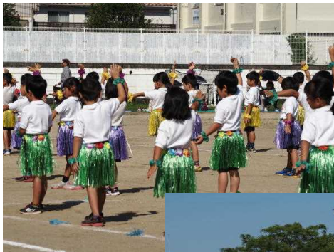
【1・2年】 みんないっしょにフラ！

この運動会を通して、子どもたちはまたひとつ成長したように感じます。この頑張り、やればできるという思いをこれからの学校生活に生かしていけたらと考えています。今後の子どもたちの活躍を楽しみにしててください。どんどん恒富小から元気を発信していきます！