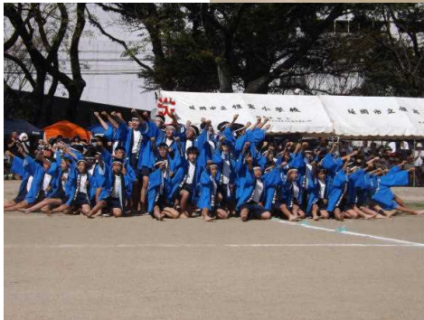
【5・6年】 恒っ子 ソーラン