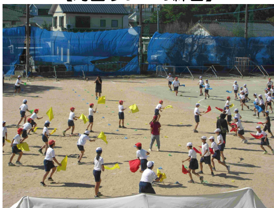
【表現の練習をする5年生】