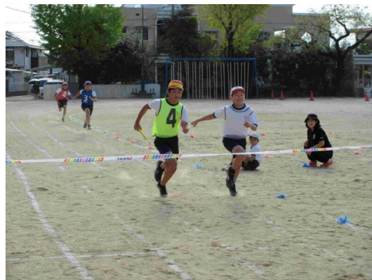
【対団リレーの練習】

新校舎になり、図書館もきれいに整備しています。本を借りることもパソコンで簡単にできます。最近は活字離れが深刻になってきましたので、子どもたちには是非、図書室を利用してたくさん本を読む機会を増やしてほしいと思っています。小さい頃に本を読む子は賢くなりますし、集中力・忍耐力等も高まってきます。学校の図書館を利用することも大切ですが、休日には親子で市立図書館等に足を運んで一緒に本を読む時間を共有することも推奨します。特に小さいお子さんがいるところは携帯等は見せず、読み聞かせをすることを推奨します。是非そんな時間を作っていたら、子どもたちの語彙力も高めてほしいと思います。