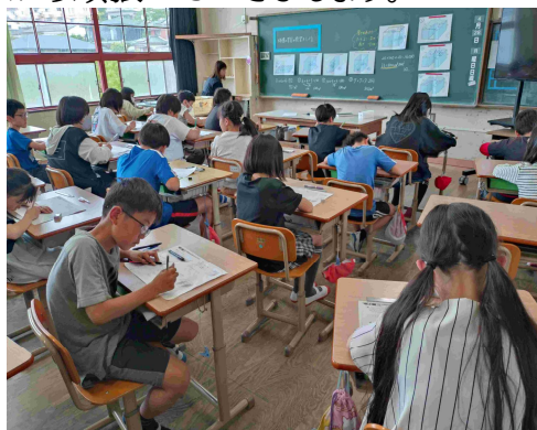
【5年2組の算数の授業】

4月25日(金)は今年度初めての参観日でした。多くの保護者の皆さんが参加され、子どもたちの授業の様子を観ていただきました。一年生は初めての参観日ということで緊張している姿も見られましたが、意外と堂々としていてびっくりしました。他の学年もめあてをしっかりともち、ペアやグループで話し合い等もしながら学習を進めていました。4年生では黒板を使ってみんなの前でしっかり発表する姿も見られ、楽しそうでした。授業後はPTA総会もオンラインで行われたり、学級での役員決めも行われたりして、スムーズに進められたようでした。令和7年度会長さんを中心に南小学校のPTA活動が楽しく、充実したものになるよう、みんなで協力しながら頑張っていきましょう。