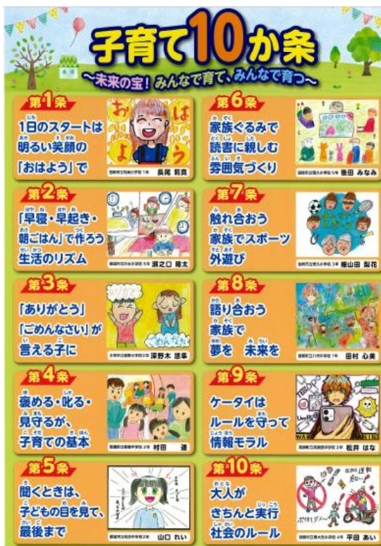
【県PTA連合会子育て10か条】

県PTA連合会では右のような子育て10か条を推奨しており、私もこの子育て10か条は、子育てにおいてとても重要なことだと思っています。8月1日から夏休みに入りますが、ご家庭ではこの10か条を意識して生活してほしいと思います。夏休みは生活のリズムが崩れやすいので、事前にしっかりと過ごし方の計画を立てて、朝は学校があるときと同じような時間に起き、家族一緒にご飯を食べるということをしっかり行ってほしいと思います。朝早く起きるためにも、ゲームや携帯で動画を見ることなどは時間を守り、夜更かしをしないようにすることも重要なポイントだと思います。そして、親子のふれあいを深めるためにも家族で遊びに行ったり、運動をしたりするような機会もあると良いかと思います。あっという間に夏休みは終わります。やるべき事はしっかりと行い、思い出に残る夏休みにしてほしいと思います。