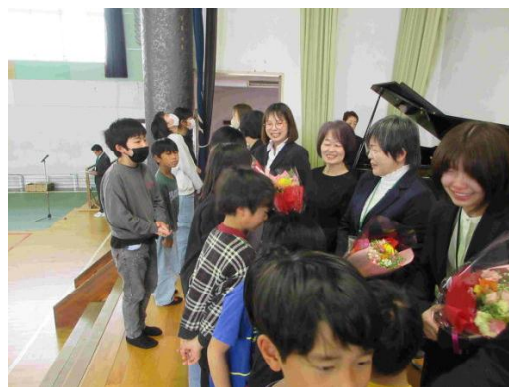
【転出の先生へ花束を渡す児童】

3月27日(金)は離任式でした。今回の異動で15名の先生方が退職や転出で本校を離れることとなりました。体育館には春休みですが、たくさんの児童が集まって先生方の別れのあいさつをしっかりと聞いていました。出会いがあれば別れもあります。本当に離任式は寂しい気持ちになります。先生方のあいさつ中に涙を流す児童もたくさんいて、本当に素晴らしい先生方だったと感じました。これからそれぞれの道で南小学校で培った力を発揮して、頑張してほしいと思います。