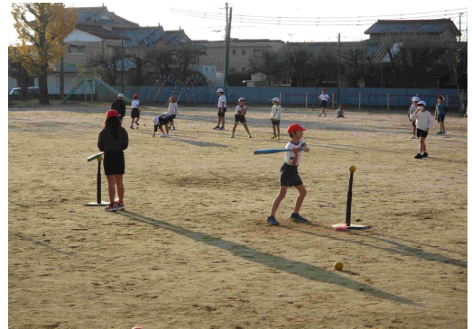
【寒さに負けず運動する3年生】

5年生のバスケットボールでは、グループの練習をしながらどうやったらパスが通るのか？どうしたらパスをカットできるのかをみんなで話し合いながら練習を行っていました。体育においても考えながら運動を工夫することはとても大事なことです。みんなで話し合い、考えを深めることで、始めより良い動きができていました。