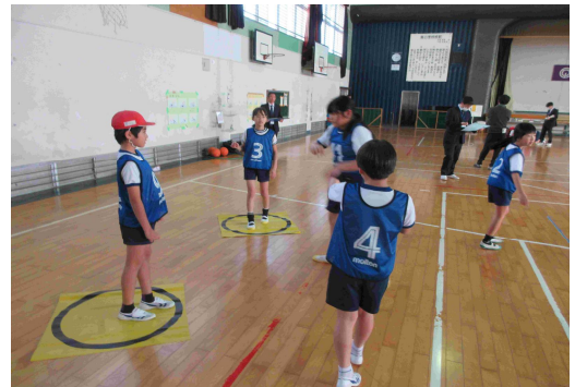
【動きを確認する5年生】