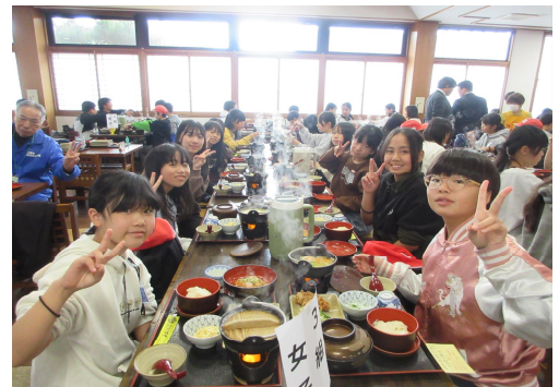
【だご汁おいしかったよ】