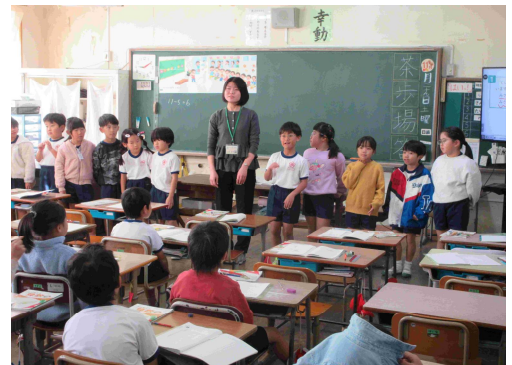
【2年生の算数の授業】