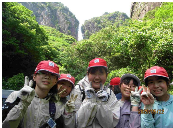
【布引の滝をバックに記念撮影】

翌日は木のペナント作りを行いました。キリで少し穴を開け、そこにネジをつけるのに悪戦苦闘していましたが、それぞれのむかばきの思い出が絵となり、力作が完成しました。自然の家での心構え「規律」「協同」「友愛」「奉仕」の4つのことがしっかりできた2日間でした。