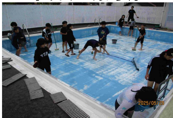
【とてもきれいになった小プール】