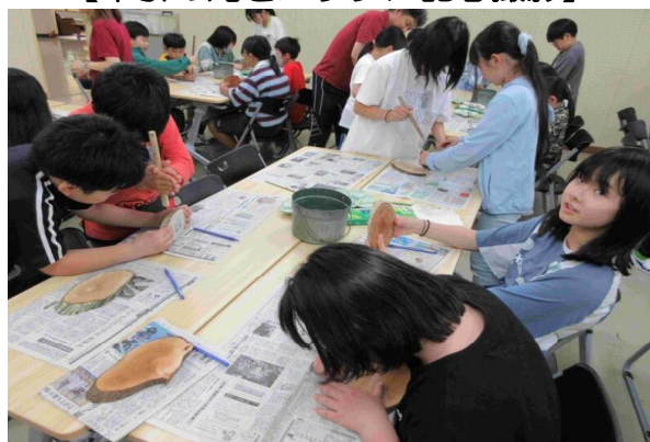
【ペナントづくりに夢中】