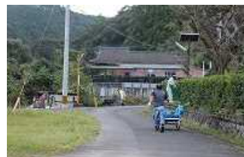
剪定して垣根もすっきり