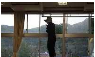
教室の窓もきれいに