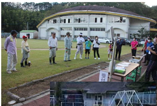
黙々とトラックの草取り

校庭・校舎周りの樹木剪定、学校菜園周りの駐車場の草刈り、教室の窓ふき、体育館ギャラリー清掃など、日頃学校職員では手が回らない所の作業をしていただきました。日暮れの6時半まで一生懸命作業していただきました。子どもたちが、すっきりときれいになった学校で学習できることに感謝いたします。