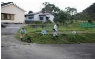
学校菜園周りの草刈り