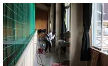
体育館のギャラリーも