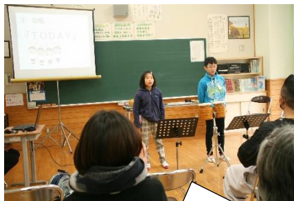
合唱「TODAY」～元気な歌声をひびかせてくれました