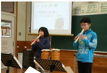
リコーダー奏「世界の約束」～高い音もきれいにそろっていました。