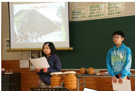
プレゼン発表「はらわく体験を振り返って」～他校の友達との関りや多くの学びが伝わってきました

月日が経つのは本当に早いもので3月を迎えました。先日、学校では1年間の学習をまとめて発表する「学習発表会」を行いました。1年間の学習を素直にそして一生懸命取り組んできたことが分かり、二人の子どもたちの大きな成長が感じられる素晴らしい発表会でした。