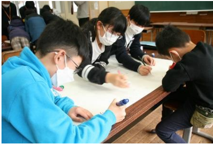
グループで協力し模造紙にまとめる