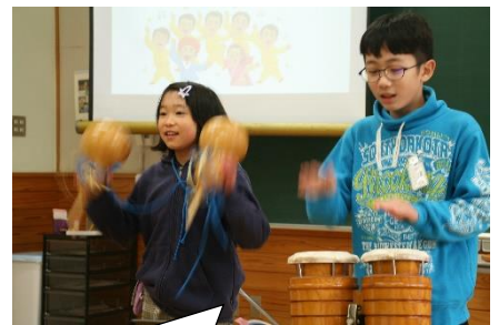
合唱・合奏「おどれサンバ」～楽しく歌いながら合奏しました