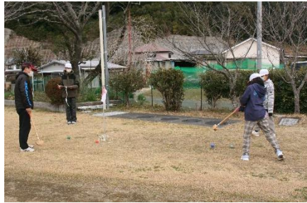
みんなでランドゴルフを楽しむ