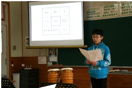
発表「将来の夢」～夢をかなえるために作った目標達成シートをもとに発表しました