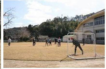
たくさんの仲間と思いっきりサッカー!