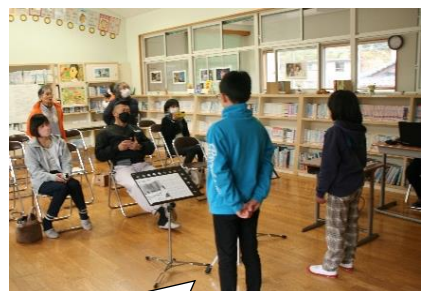
全員合唱～懐かしい曲「ふるさと」を参加者全員で歌いました。