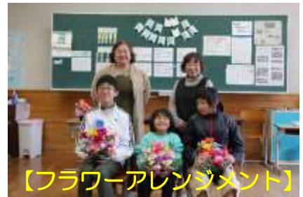
【フラワーアレンジメント】