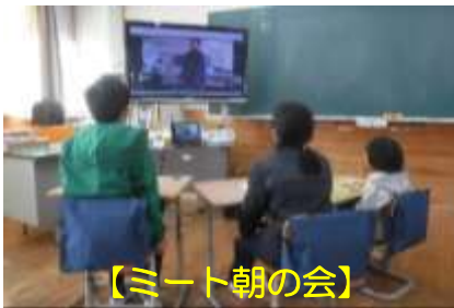
【ミーティング朝の会】