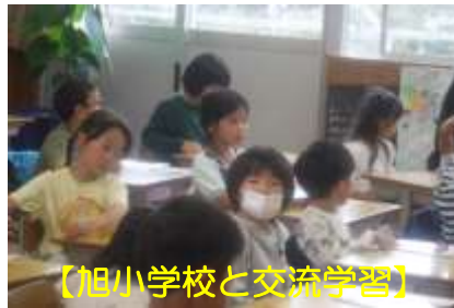
【旭小学校と交流学習】