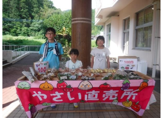
【いつもたくさんのお客さんです】