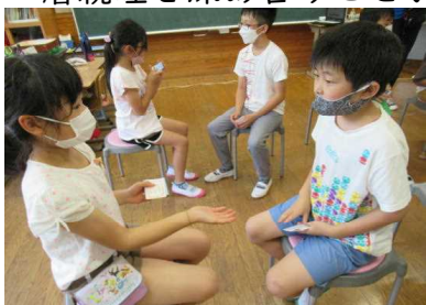
英語で名刺交換をしました