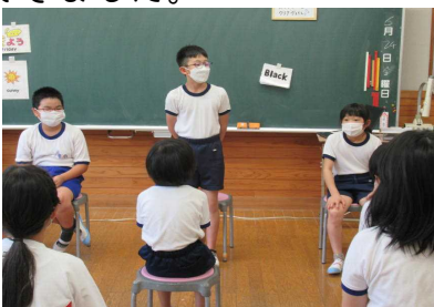
英語での自己紹介