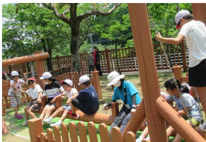
遊具で大はしゃぎ!