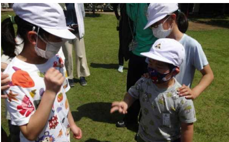
「じゃんけん列車」もしたよ