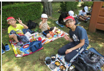
お弁当、おいしかったあ!

6月24日(金)にもチャーター船「美津丸」で島野浦学園へ行き「南浦いきいき学習」を実施しました。今回は、3校の仲間と一緒に学習をしながら交流を深めました。