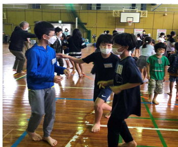
レクリエーションも楽しかったです

子ども達は、これからの活動をとっても楽しみにしています。楽しいことだけでなく、大変なことも少なからずあるかもしれません。しかし、それも子ども達の成長にとってプラスに働いていくように支援していきたいと思います。