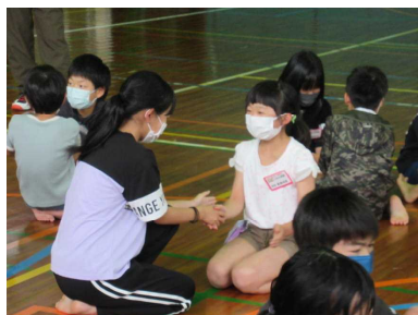
班の友達と仲良くなりました