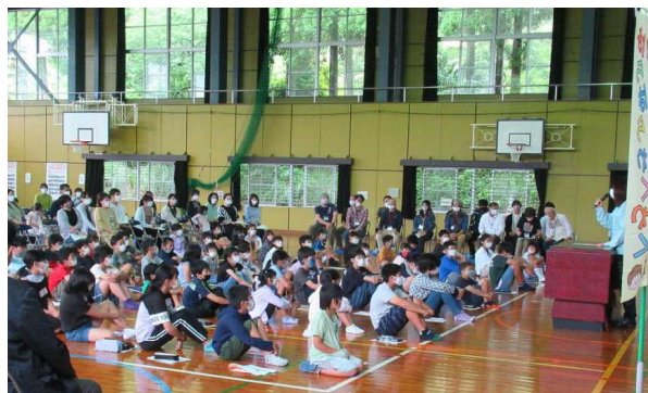
多くの参加者と初めての出会い

体験を通しながら異学年の子ども達と交流を深めていくことができるので、極少人数の浦城小の子ども達にとっては、コミュニケーション力を付けていくためにもとても意義あるものであると考えています。