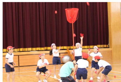
体育で玉入れをしての交流