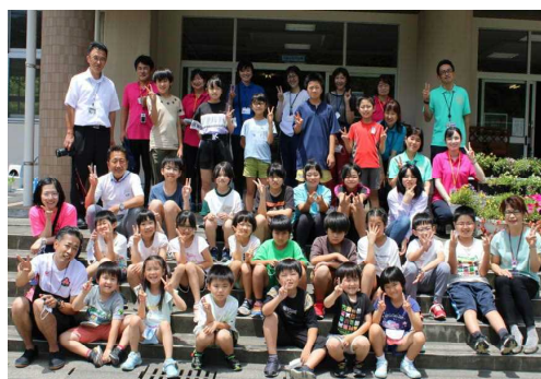
3校全員ではいポーズ!

体育でフリスビーを使ったドッジボールや玉入れ、大玉転がしをしたり、外国語活動で名刺を使って自己紹介をし合ったりして交流学習をしました。お弁当や昼休みの時間にも3校の仲間と一緒に過ごして一層親睦を深め合うことができました。