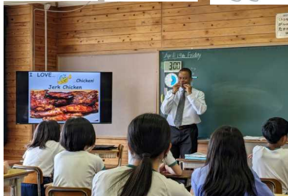
【陽気なジャクソン先生】