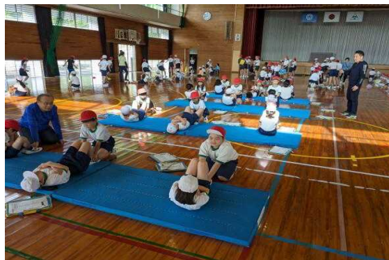
【上体起こしの様子】

学校ではその課題解決のために「スクールスポーツプラン」を作成し、体育の授業の改善や外遊びの奨励などを行っています。伊形小学校の子どもたちは昼休みや放課後も、外に出て遊んでいる人も多いので、授業中の運動量確保にしっかりと取り組んで体力向上に努めていきたいと思えます。ご家庭でも休日の日には親子で運動する時間をもっていたらと親の健康増進にもつながりますので、是非、親子で取り組んでみてください。