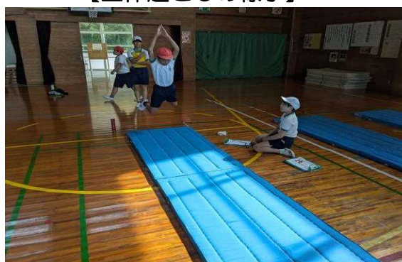
【立ち幅跳びの様子】