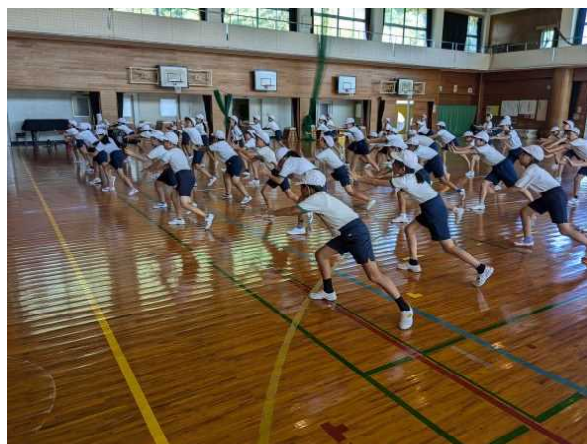
【ソーラン節の練習をする5年生】

まだ暑い日が続いていますが、10月13日に開催される運動会に向けての練習が始まりました。かけこでタイムを計ったり、ダンスの練習等が行われたりと運動場や体育館が賑やかになってきました。今日は5年生が体育館でソーラン節の練習を行っていました。四股立ちを基本に膝を深く曲げたりの動作がたくさんあるので、子どもたちも大変そうでした。しかし、みんな暑い中でも一生懸命に取り組んでおり、とても素晴らしいと感心しました。運動量も多いので、明日は筋肉痛になるかもしれないですね。これから約1ヶ月練習が続きますが、早寝・早起き・朝ご飯を徹底し、体調管理を整えしっかり頑張してほしいと思います。今年の運動会はお弁当を食べ、午後からも競技がありますので、しっかり体力もつけてほしいです。家でどの団らんでは運動会を話題にしてもらい、子どもたちの頑張りを褒めていただきたいと思います。