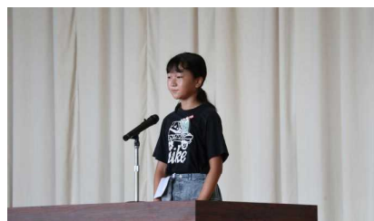
【先生の話をよく聞く児童】