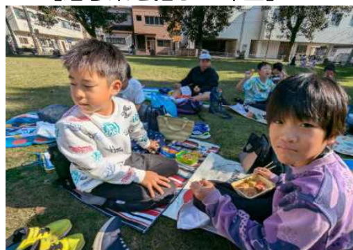
【お弁当を食べる3年生】