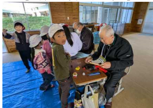
【おもちゃをつくる1年生】