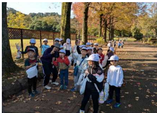
【落ち葉を拾う1年生】