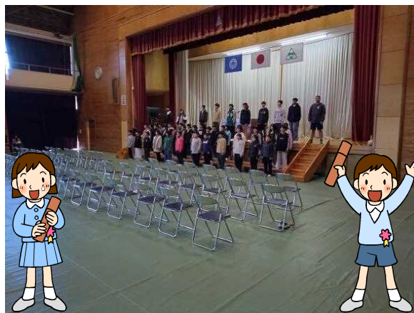
【呼びかけをする6年生】

3月12日(水)に卒業式の予行が行われました。今まで数回練習を行ってきましたが、今回は当日と同じ流れで行いました。一人一人卒業証書をステージ上で授与され、緊張の表情でしたが、6年生は堂々としていて、とても立派に頑張ることができました。5年生も一緒に参加していますが、呼びかけや歌、両学年しっかりできて、特に歌のハーモニーがとても良かったです。あと2週間あるので、細かなところにも気を配って練習し、本番を迎えてほしいと思います。きっと感動する卒業式になると思います。