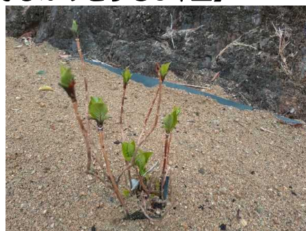
【新芽が出てきたあじさい】