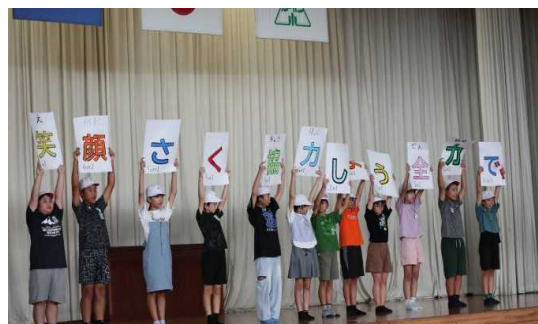
【今年度のスローガン】

家庭内でのルール作りやフィルタリングの設定、様々なりスク等の話をしていただき、有意義な時間となりました。講話に参加した学級副委員長さんからは懇談の中でも他の保護者に伝達していただきました。保護者の皆様、お忙しい中、参観ありがとうございました。