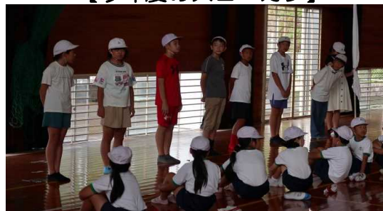
【白団の団長とリーダー】