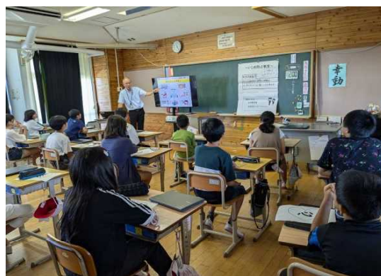
【非行についての講話】