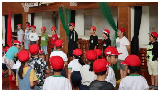
【赤団の団長とリーダー】