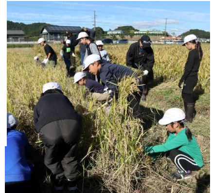
【上手に刈りとる5年生】

残念ながら今年は異常気象により、餅米・サツマイモともに収穫量が激減してしまいました。次年度は、気象状況も考えながら、計画を進めていければと思っています。