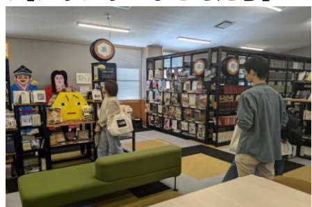
【図書館ぶん文Bunの様子】

家庭教育学級で椎葉村へ視察に行きました。椎葉村の交流拠点施設【かてりえ】では図書館【ぶん文Bun】を見学したり、【ものづくりLab】では木製のキーホルダーを製作したりしました。本を読みたくなるような仕掛けのある図書館です。遠いですが、是非親子で行ってほしいです。