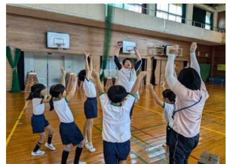
【ノリノリの子どもたち】

県内外・海外でも活躍しているコンテンポラリーダンスをおこなっている「んまつーポス」という団体が体育の表現の授業を行いました。3年後に行われる国民スポーツ大会・全国障害者スポーツ大会に向けての表現を子どもたちに教えていただきました。表現の中には子どもたちが考えた表現も入っていて、子どもたちはのびのびと表現活動に取り組みました。授業後には踊った様子を動画で鑑賞することもできました。