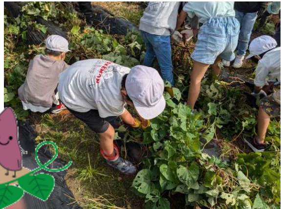
【サツマイモを探す2年生】

この後、餅つき・お芋パーティーが開催されますが、またご協力をよろしくお願いいたします。