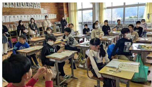
【4年生の国語の授業】

明日からは冬休みに入りますが、規則正しい生活に心がけながら、年末や新年をご家族で楽しくお過ごしください。