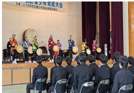
【橘太鼓響座の演奏】