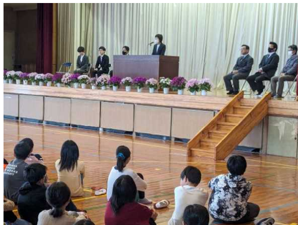
【新任の先生方のあいさつ】

4月6日(土)～15日(月)の10日間、春の全国交通安全運動が行われています。学校入り口に地域の皆さんが交通安全の幟を立てられ、子どもたちも交通安全に気をつけて登校しています。学校協力者のみなさんから子どもたちは登下校を見守られているので、近年は大きな事故も起こっていませんが、交通量もかなり多くなっている状況なので、交通事故の可能性も高まっていると思います。日頃から学校でも交通安全についてしっかりと指導を行い、子どもたちの安全意識を高めていきたいと思っています。ご家庭でも、交通ルールや自転車の乗り方などについて、お話をいただければありがたいです。