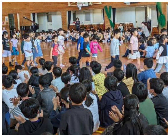
【みんなの前を歩く一年生】

4月25日(木)の業間の時間に、一年生を迎える会を行いました。例年の行事になりますが、体育館に一年生が入場し、全校児童で校歌を歌い、一年生を迎えます。そして、六年生が一年生のために、学校での一年間の行事について面白く出し物を行うなどして、よくわかるように紹介しました。とてもわかりやすく面白かったので一年生はとても喜んでいました。六年生は一年生の前で堂々とし物を行い、最高学年としての自覚も芽生え、これからが楽しみだと思った瞬間でした。すべての学年の子どもたちが揃い、これから新たな伊形小学校として、みんなで協力しながら楽しい学校生活を送ってほしいと思います。