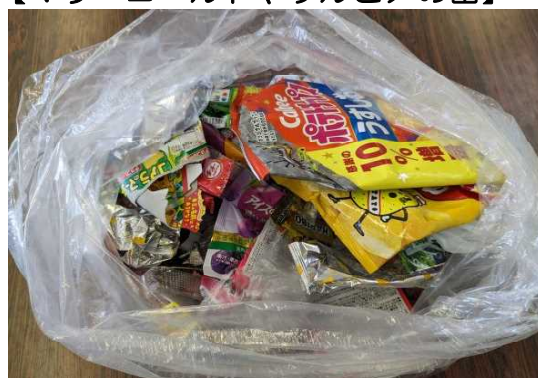
【公園に落ちていたゴミ】

5月1日の全校朝会で公園のゴミについて話をしました。内容は公園でゴミを拾ってくれる子どもたちがいて、とても素晴らしいことですが、ゴミを公園に捨てる子どもたちも多いことはとても残念だというものでした。その話を2週間くらいですが、ある公園には写真のように大きなビニール袋いっぱいのゴミが落ちていました。話をしっかりと聞いて心に響けばこんな風にはならなかったと思います。とても残念に思います。自分たちが遊ぶ公園はゴミがいっぱいよりきれいな方がいいと思います。本日各学級でゴミについての指導を行いました。ご家庭でも、公園の使い方やゴミについてのお話をしていただけるとありがたいです。よろしくお願いします。