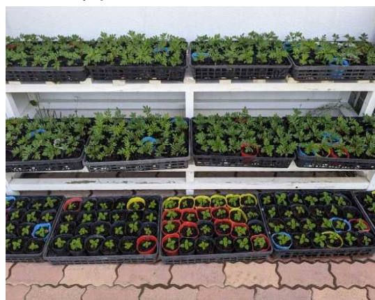
【マリーゴールドやサルビアの苗】