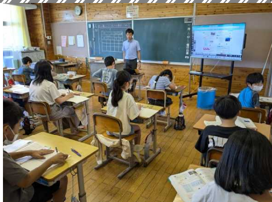
【4年2組の授業の様子】

7月6日(土)は参観日でした。多くの保護者の皆さんが熱心に授業参観され、子どもたちも積極的に発表したり、友達と話し合ったりして、一生懸命に取り組んでいました。子どもたちはやはり親が見に来てくれるのはうれしいものです。参観授業中での我が子の姿を見て、良いところは褒め、もう少し頑張ってもらいたいところはしっかりと伝え、よりよい方向に仕向けていくことは親の大事な子育てになると思います。食事の時にでも、参観授業のことを話題にしながら、会話をし親子の絆をさらに深めていただきたいと思います。子どもたちも親がしっかりと自分を見てくれているとえば、やる気にもつながりますよ。