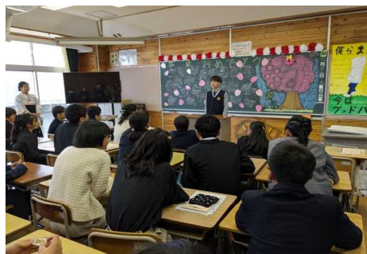
【教室での児童一人一人からのことば】