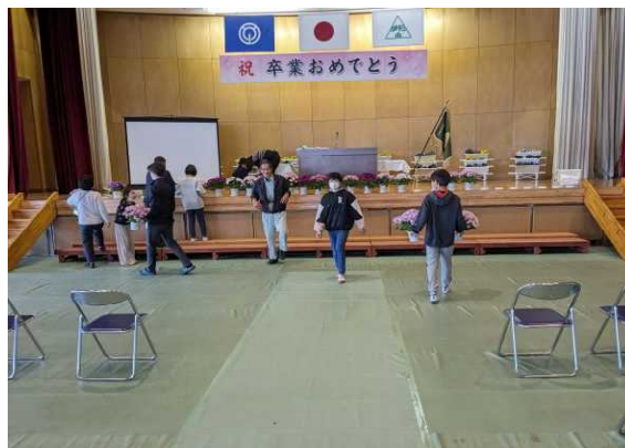
【会場設営をする5年生】

23日（土）の卒業式に向けての準備が行われました。4・5年生が場所ごとに分かれて、体育館の会場準備や、校舎から体育館まわりの清掃をよく頑張りました。6年生の卒業式のために一生懸命にがんばり、さすが伊形っ子だなと感心しました。会場には丹精込めて育てたパンジーの花がステージやフロアーに並び、在校生のメッセージも掲示され、素晴らしい会場に変貌しました。