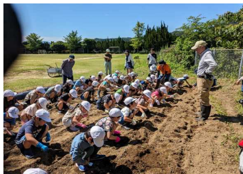
【 一列に並んで畝作り 】