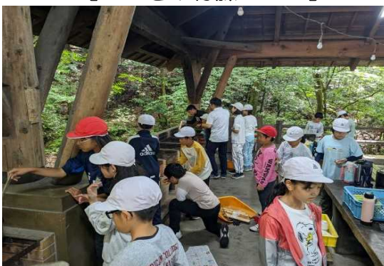
【 2日目の飯盒炊爨 】