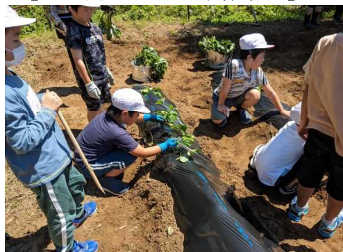
【 苗植え 】