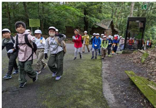
【 いざ！行藤山へ 】