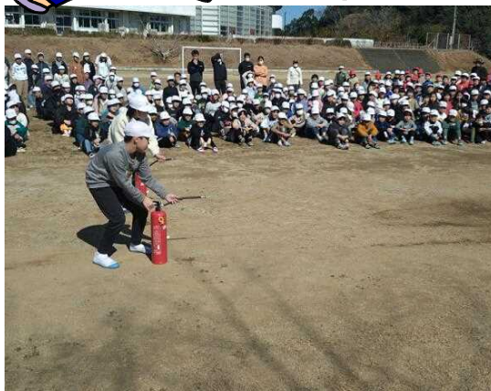
【水消火器を使つての消火訓練】