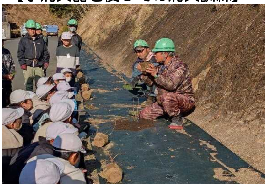
【植え方の指導を受ける6年生】

始めに業者の方からあじさいの植え方を指導していただき、実際に苗を丁寧に移植しました。みんな話もせず、一生懸命に植えていて、さすが6年生だなと感じました。これから苗が生長し、隣の苗と重なる大きさになるには3・4年くらいかかるようですが、1年で50cmくらいは伸びるそうなので、今年の梅雨時期には、まだ物足りないとは思いますが、100本の苗が一斉に花を咲かせれば結構見栄えするかもしれませんね。中学校に行ってもこのあじさいのことは忘れずに見に来てほしいと思います。