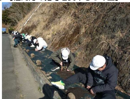
【一生懸命に作業中！】