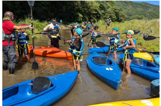
【カヌーに挑戦する子どもたち】

なお、ケーブルメディアwaiwaiの取材がありましたので、この様子は8月2日(金) 18:30から放送されます。再放送も随時あるそうなので是非ご覧ください。