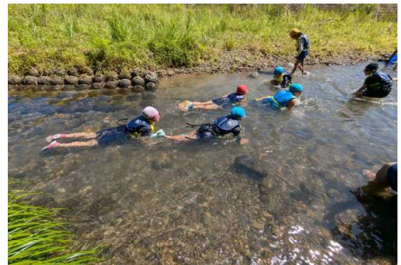
【清流を楽しむ子どもたち】