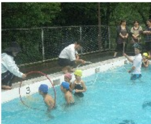
お母さん達の前で輪くぐりを披露 低学年

飽きないかなとの思いの問い「子どもたちの水泳の上達ぶりを見ていただくのが目的です。」「他の教科の参観ではなくて、毎年同じ水泳では