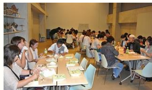
7月27日 家庭教育学級「うみたまご」研修