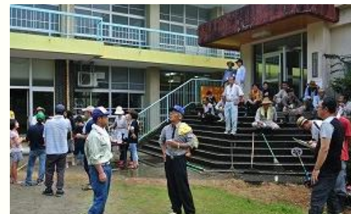
8月18日 PTAと地域の方も参加して奉仕作業で、一休み