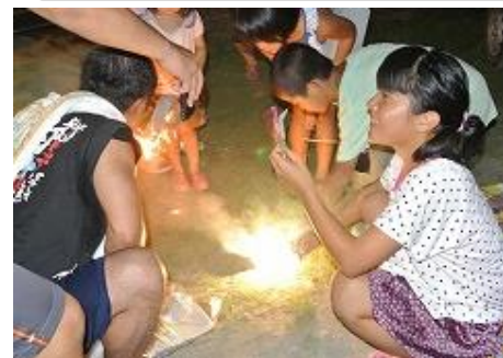
思い思いに花火を楽しみました。