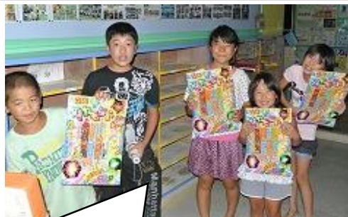
8月17、18日全校親子キャンプ中学生をリーダーに、怖い理科室に置いてある花火を見事ゲット!