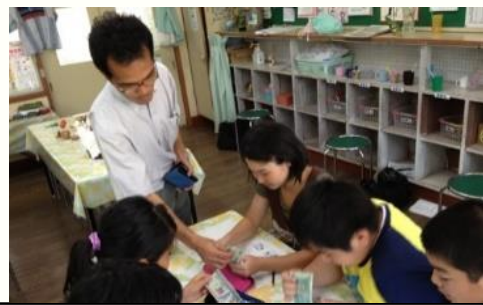
7月21日 グアテマラ日本人学校に派遣されている先生が一時帰国し、国際理解の授業を行いました。